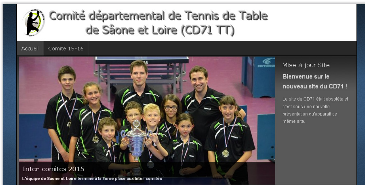
Maquette du nouveau site en cours de test

Le site http://www.cd71tt.com permet de communiquer les résultats ainsi que les différentes activités pongistes du comité ou de ses clubs. Avec 28000 visiteurs environ sur cette saison, il est dans la moyenne des années précédentes.